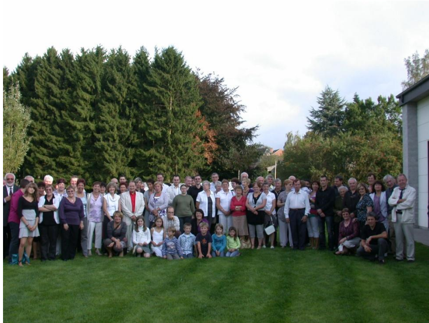
Les acteurs et les membres de la FCWGLB, lors de la remise du Singlî d' Bwès à Sibret